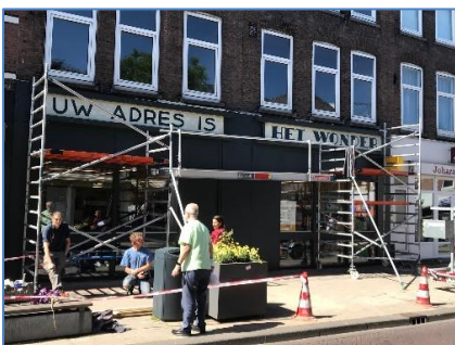
De Noordmolenstraat 76-78 met de bijzondere gevelplaat 'Uw adres is het wonder'

Redding gevelpaneel 'Uw adres is het wonder'