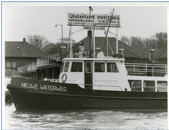
De quarantaine-inrichting op Heijlplaat, foto Stadsarchief Rotterdam