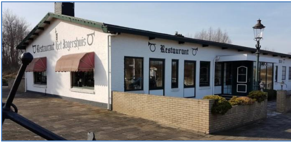
Het Jagershuis, onderdeel van de Atlantikwall is in 2020 officieel gemeentelijk monument geworden

In april 2020 werd 'het ensemble Voorduin'(Jagershuis) te Hoek van Holland op voordracht formeel aangewezen als Gemeentelijk Monument. Het maakt onderdeel uit van de Atlantikwall uit WO2.