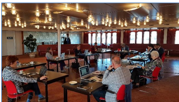
De algemene ledenvergadering vanaf het SS Rotterdam, de leden in Zoom