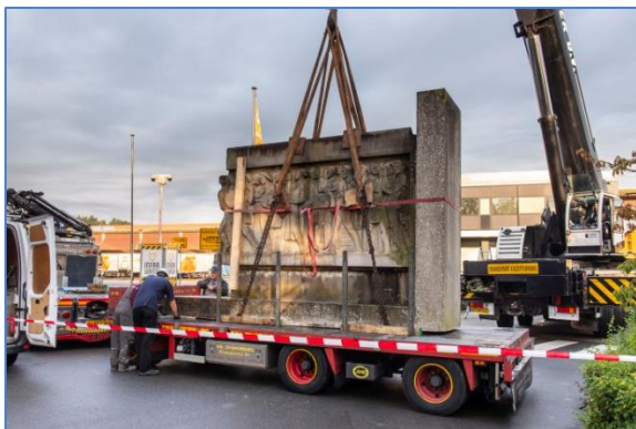
De Bijenkorfsteen wordt verplaatst voor restauratie