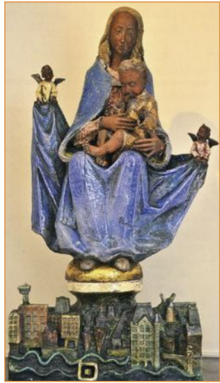
De 'Rotterdamse Madonna', 1960.