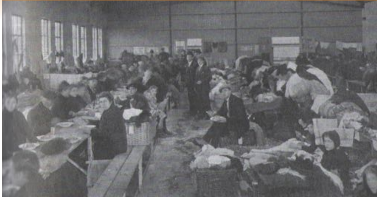
Zo werden veel Fransen gehuisvest.

voor iedere klacht zijn zes instanties nodig, waardoor alles in wanorde geraakte. Vrouwen en kinderen zitten hier te rillen van de kou, zonder kolen, zonder warme kleeven. Dagenlang is er geen vleesch, door gebrek aan verzorging bezwijken de zwaksten. Het brood dat door de Nederlandsche regeering verschaft wordt, is niet te eten'. En zo ging het nog even door. Met de krijgsgevangenen die op doortocht waren, leek het beter te gaan. Enkelen waren behept met luis, maar besmettelijke ziekten kwamen vrijwel niet voor. Nederland droeg zijn steentje bij met 'grensconcentratiekampen' en 'afvoerdepots' maar liep aan tegen het gebrek aan scheepsgelegenheid en een gebrekkige spoorverbinding. Via Rotterdam vertrokken bijna 131.000 krijgsgevangenen van de Entente (Engelsen, Russen enz.) richting huis, waarna nog 80.000 Duitse krijgsgevangenen volgden en 300.000 Britten van het bezettingsleger in Duitsland. Een ware volksverhuizing.