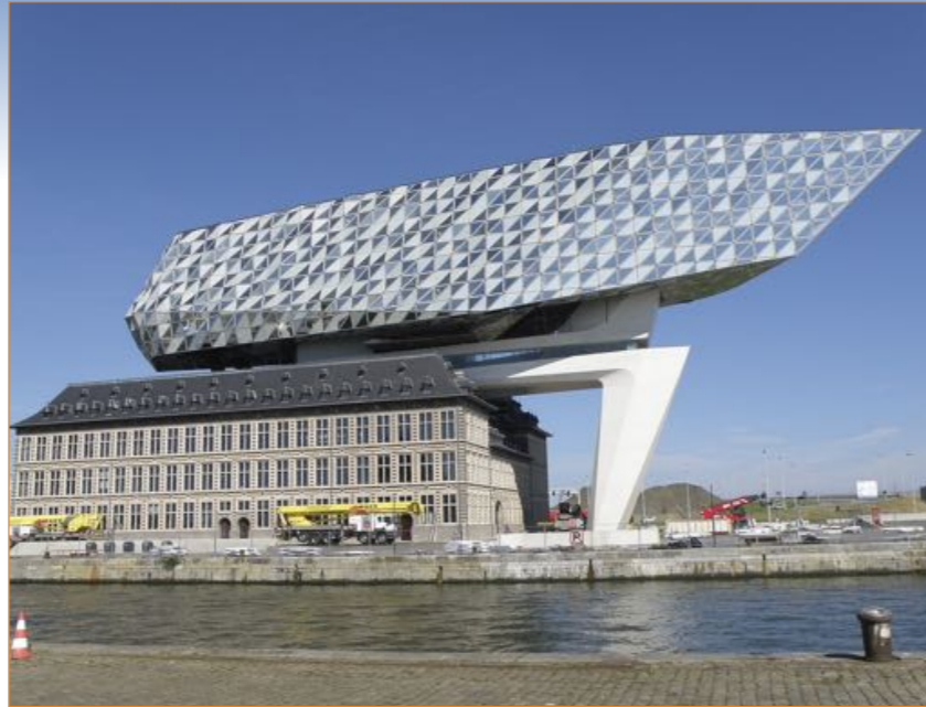
Het Havenhuis op het Antwerpse Eilandje.

21.30 uur borrel, tot 22.00 uur Graag aanmelden voor dit HW&WC vóór 1 mei a.s. via e-mail roterodamum@roterodamum.nl , met daarbij graag apart uw aanmelding als u ook blijft of speciaal komt voor de film om 19.45 uur. Locatie: gebouw De Heuvel, Grotekerklein 5, 3011 GC Rotterdam.