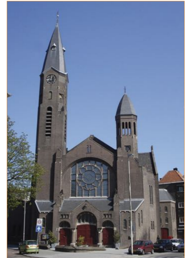
De Bergsingelkerk in het Liskwartier.