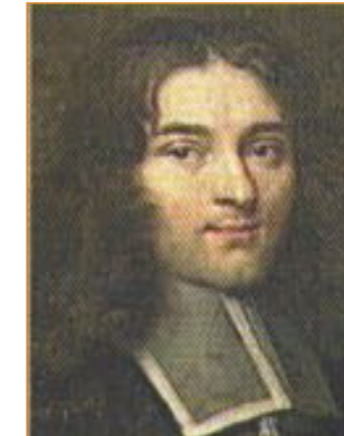
Links: John Locke (1632-1704).