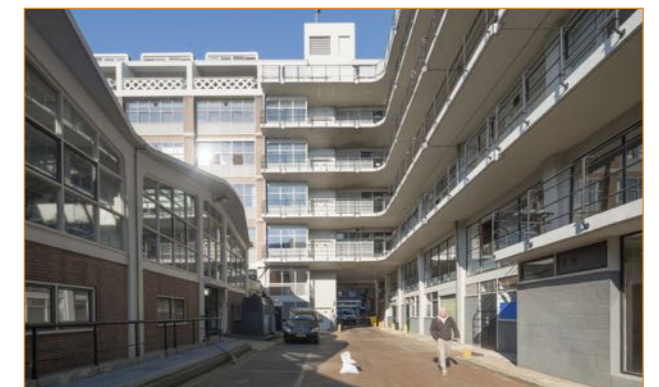
Het Industriegebouw Goudsesingel.

Op 18 mei 1947 vond de eerste Opbouwdag plaats. Op die dag werd ook de eerste paal geslagen voor Het Industriegebouw aan de Goudsesingel. Om deze 70ste verjaardagen te vieren keert het HW&WC nog een keer terug. Met een programma dat aandacht besteedt aan hoe de ondernemende mentaliteit van toen ('Aan Den Slag!') ook nu nog doorwerkt in de creatieve ondernemers van nu. En ook bij wijze van herkansing, nu met beter verstaanbaar geluid. Het belooft een zeer afwisselend en visueel rijk programma te worden waaraan o.a. het gemeentelijke bureau Monumenten en filmspecialist en tentoonstellingsmaker Joop de Jong hun medewerking verlenen. Eerder die middag zijn er ook rondleidingen door het