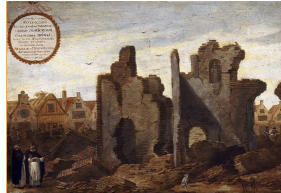
Schilderij uit 1657 van Cornelis Saftleven: Ruïne van het in 1563 verbrande Dominicaner- of Predikherenklooster aan de Hoogstraat.

Op 14 mei 1940 bombardeerde de Duitse Luftwaffe Rotterdam. Door die aanslag en de daarop volgende branden werd een groot deel van de stad verwoest. Een gebeurtenis die velen zich nog herinneren en de generaties na deze misdaad leven nu, ruim 70 jaar later, in een stad die nog steeds de sporen draagt van die grote aanslag. Het was niet de eerste keer dat onze woonplaats door een grote brand werd aangetast.