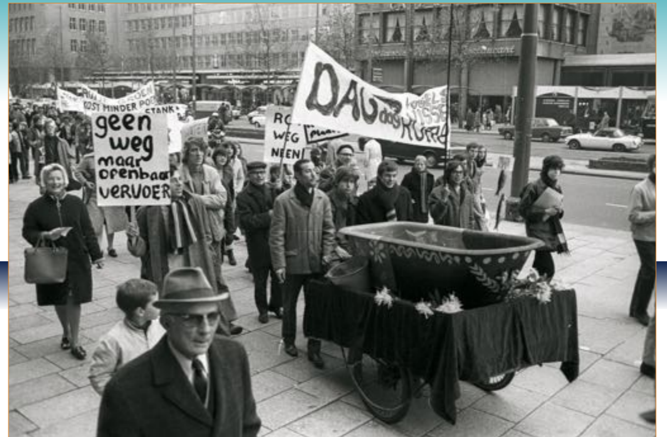
Bewoners van het Oude Noorden en Crooswijk protesteren in 1970 tegen plannen om een deel van de Rotte te dempen voor de aanleg van een zesbaanssnelweg.

Toen het Rotterdamsch Nieuwsblad hem in 1969 interviewde zei Groeneveld dat hij eigenlijk meer plaatjesverkoper was dan fotojournalist: 'Ik geloof niet in fijne plaatjes, of niet meer tenminste. Of ik de koningin moet fotograferen, of een minister, of een jubilaris of een opoe van honderd. Het blijven opdrachten, meer niet. Doodgewoon onderwerpen die gefotografeerd moeten worden'. Groeneveld overdreef natuurlijk, maar deze uitspraak typeert wel degelijk hoe hij zijn werk benaderde. Als fotograaf was hij bijzonder doelgericht. 'Was er een openingshandeling dan moest die erop', zegt Hans Keijzer, die van 1966 tot 1973 als assistent-fotograaf bij Groeneveld werkte en nu als vrijwilliger meehelpt diens collectie te ontsluiten. 'Een foto van het doorknippen van een lint was alleen goed, als je