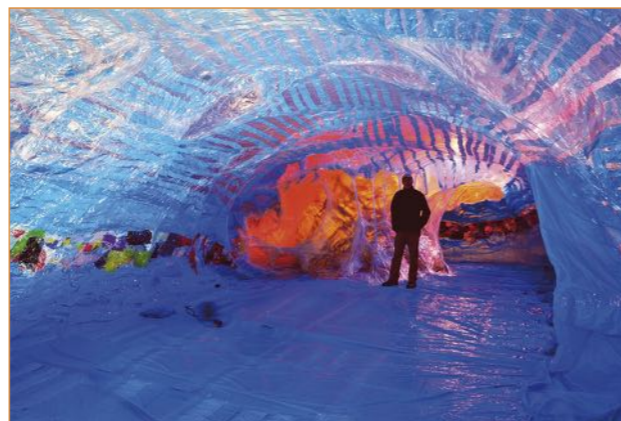
Een luchtfoto van het Kunstfort bij Vijfhuizen. Daaronder een sfeerbeeld van Blow up!

Vergeet niet uw Museumjaarkaart mee te brengen voor het bezoek aan het gemaal.