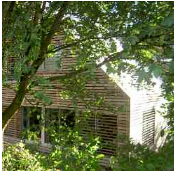
Het bekronede pand

enthousiasme voor het behoud ervan. Met succes: de hoeve is onlangs alsnog als gemeentelijk monument aangewezen. Omdat het inmiddels in slechte staat verkeerde, hebben de nieuwe eigenaren een uitgebreide restauratie laten uitvoeren en de hoeve voorzien van een eigentijdse achterbouw. Voor deze geslaagde restauratie krijgen de eigenaren het monumentenschildje. Door de ingreep is het pand weer in oude luister hersteld en heeft het de status gekregen die het verdient. Naast een messing gevelpenning bestaat de onderscheiding uit een oorkonde.