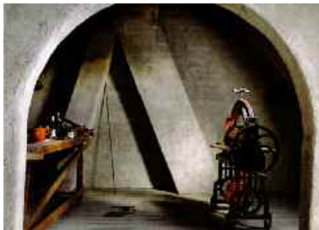
De zolder van Lede 40 waar de laatste bewoner kluste

Sinds 23 juni 2010 is Lede 40 in Vreewijk een museumwoning. De laatste bewoner is geboren in het pand en heeft het nooit gemoderniseerd. In Lede 40 wordt het verleden van het tuindorp tastbaar. Eigenaar Com-wonen heeft het Historisch Museum Rotterdam gevraagd de unieke woning in beheer te nemen. Het museum wil met de museumwoning niet alleen een verstild tijdsbeeld presenteren, maar gaat met buurtbewoners op zoek naar het verhaal van alle tijden van Vreewijk. De woning aan Lede 40 geeft een bijzonder beeld van het Tuindorp Vreewijk aan het begin van de twintigste eeuw. De laatste bewoner, geboren in 1919 op Lede 40, is nooit verhuisd en heeft het pand in oorspronkelijke staat gelaten. Zo heeft de woning geen badkamer of centrale verwarming en is de keuken nog authentiek. Bezoekers krijgen het gevoel in het verleden van het tuindorp te stappen.