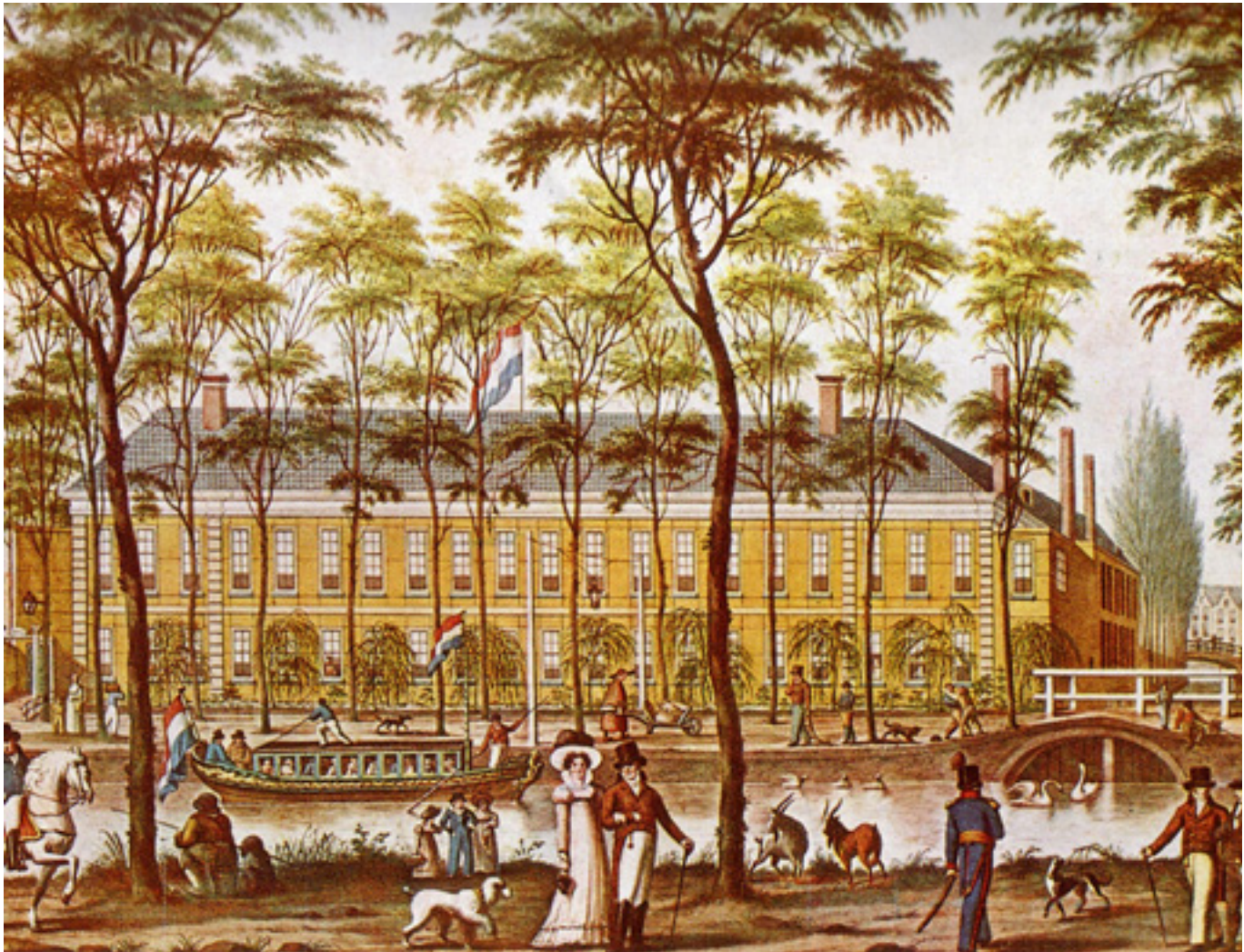
De Sociëteit Harmonie aan de Coolsingel in 1863

De voorstellingen van die Nederlandsche Opera rond 1900 waren altijd vrijwel uitverkocht, en het beste bewijs van de sympathie der Rotterdammers voor die instelling is wel geleverd in 1903, op de avond van de dag der algemene spoorwegstaking (31 Januari), toen door de omstandigheden de Nederlandsche Opera genoodzaakt was een uitvoering van Fidelio te geven zonder kostuums en zonder orkest, en toch geen der bezoekers in de weer uitverkochten schouwburg gebruik maakte van het aanbod, om in verband met de onvolledigheid der voorstelling het entreegeld terug te ontvangen. Nog in deze dagen blijkt de onverzwaktheid der Rotterdamsche belangstelling in de opera uit het druk bezoek aan de Italiaansche opera-onderneming, die hier nu reeds meer dan dertig winters haar repertoire komt spelen.