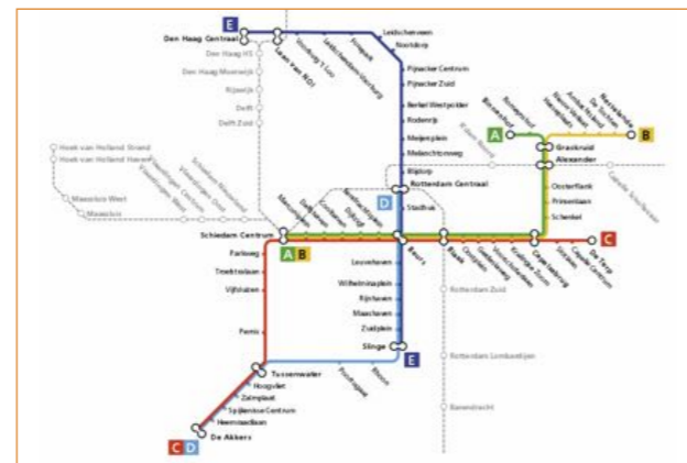
Metronet Rotterdam 2013.

Alle Rotterdammers, jong en oud, kregen ter gelegenheid van de eerste rit een kaartje aangeboden om de nieuwe oeververbinding met eigen ogen te aanschouwen