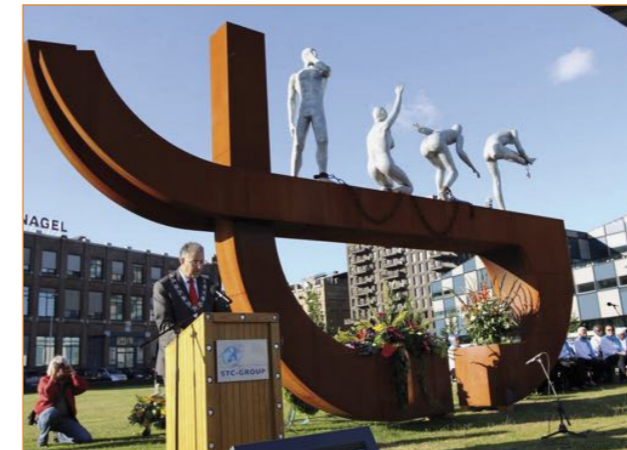
De burgemeester spreekt bij het slavernijmonument.

Op 1 juli wordt de afschaffing van de slavernij gevierd met een feestelijk gebeuren aan de West-Kruiskade: het Keti Koti Festival. Uitstekend thema voor het Historisch Wel & Wee Café, naar analogie van 4 en 5 mei, om ons te verdiepen in de vraag: wat herdenken en vieren wij?