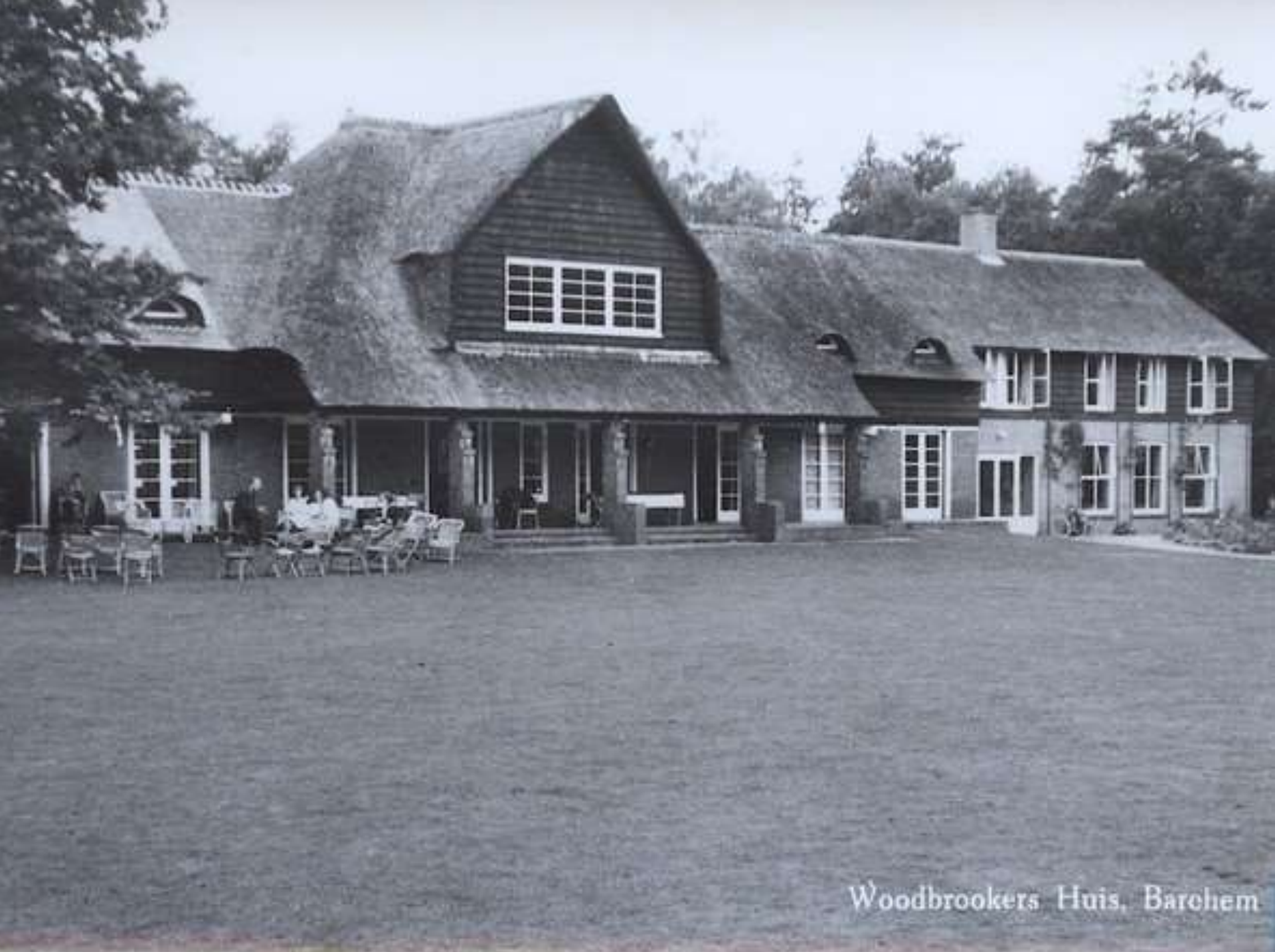
Woodbrookers Huis, Barochem