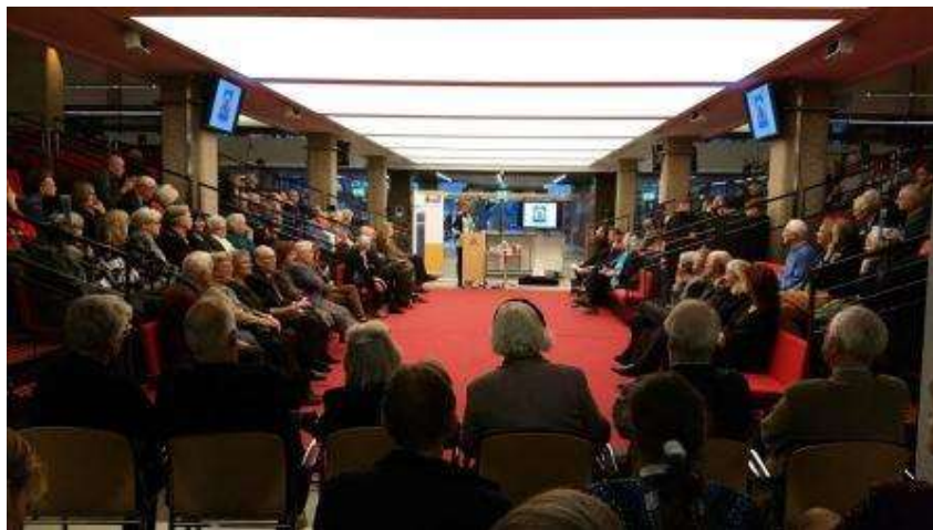
Volle tribunes in het Horizon Muziekplein van De Doelen

Het Historisch Wel & Wee Café van december was de aftrap van een serie Café's die in 2016 over de Wederopbouw zullen gaan. Het Concert- en Congresgebouw bestaat op 18 mei 2016 precies 50 jaar. De leden en andere genodigden verzamelden zich die middag op het Muziekplein.