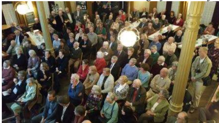
Grote opkomst in Verhalenhuis Belvédère op Katendrecht

Overigens is het nog steeds mogelijk om obligatiehouder te worden, zodat de noodzakelijke bouwwerkzaamheden en het onderhoud van het huis mogelijk kunnen zijn.